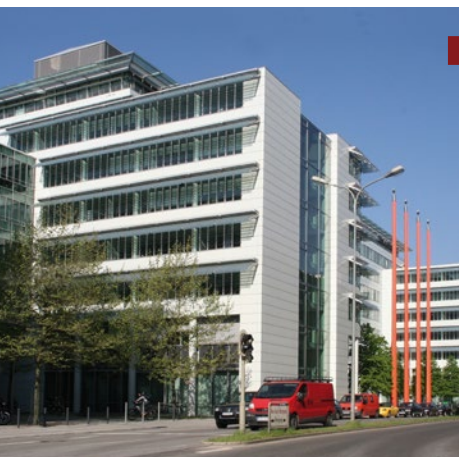
WWK: Der Münchener Lebensversicherer überzeugt mit besten Bonitätsnoten