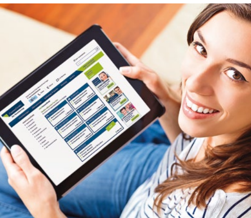
CosmosDirekt: Der reine Internet-Versicherer mit Sitz in Saarbrücken gehört zum Generali-Konzern und punktet mit Top-Werten