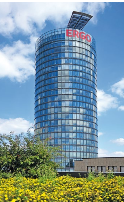
Ergo: Zur Munich Re gehörend, zählt in puncto Finanzstärke auch der Düsseldorfer Lebensversicherer zur absoluten Spitzengruppe